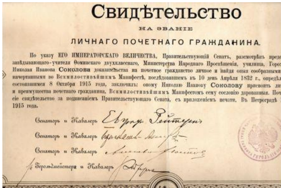
Свидетельство №5467 от 26 ноября 1915 года Соколову Н.И учителю-заведующему Фоминским 2-хклассны училищем, на звание личного почётного гражданина.