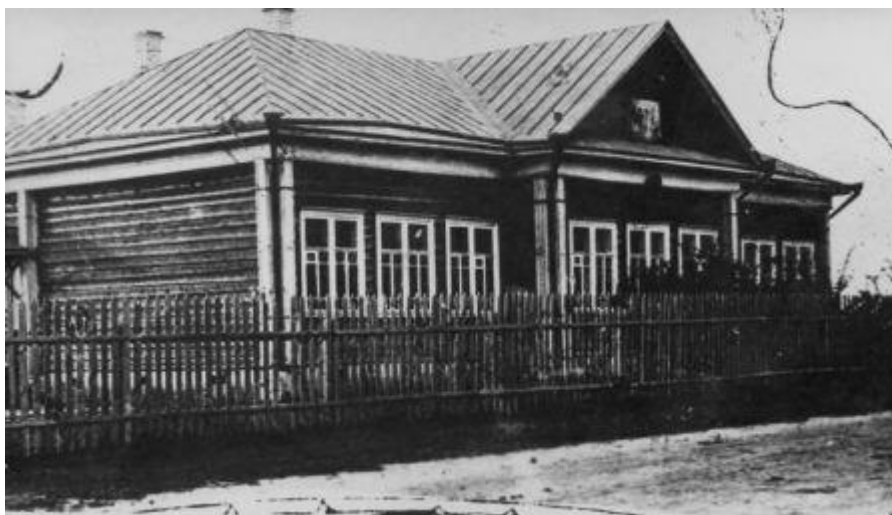
Фото «Фоминское Министерское двухклассное образцовое училище» 1903 год